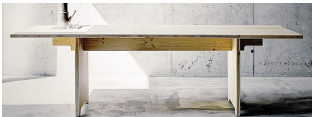
Il tavolo progettato dallo studio Pasquini-Tranfa per la Fioroni di Ardenno