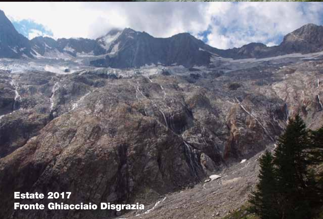
Estate 2017 Fronte Ghiacciaio Disgrazia